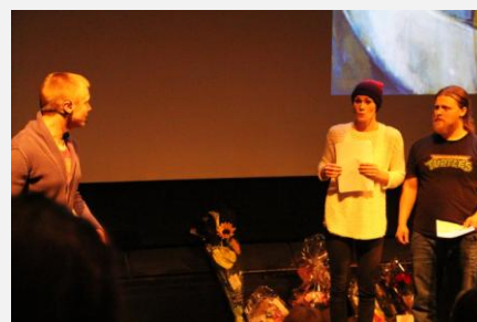
Teater Grimsborken viste en smakebit av teaterstykket «Henrik har en hemmelighet».

Ta kontakt med FFP på post@ffp.no eller telefon for å få billetter. Stykket er anbefalt for barn over 6 år. Pårørende får gratis billetter!